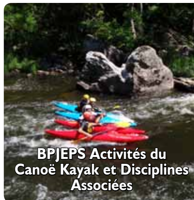
BPJEPS Activités du Canoë Kayak et Disciplines Associées