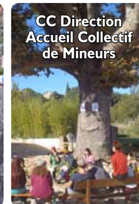
CC Direction Accueil Collectif de Mineurs

Pré-formation : 2 semaines en février et avril. Formation : 4 semaines de mai à octobre. Inscription avant fin mars, sélections en novembre.