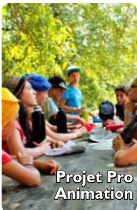
Projet Pro Animation