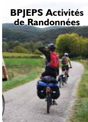
BPJEPS Activités de Randonnées