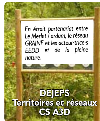
DEJEPS Territoires et réseaux CS A3D