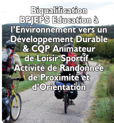
Biqualification BPJEPS Education à l'Environnement vers un Développement Durable & CQP Animateur de Loisir Sportif - Activité de Randonnée de Proximité et d'Orientation