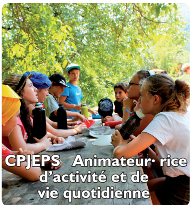
CPJEPS Animateur·rice d'activité et de vie quotidienne