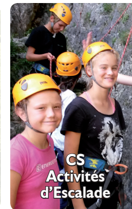
CS Activités d'Escalade