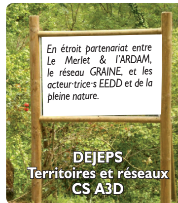
DEJEPS Territoires et réseaux CS A3D