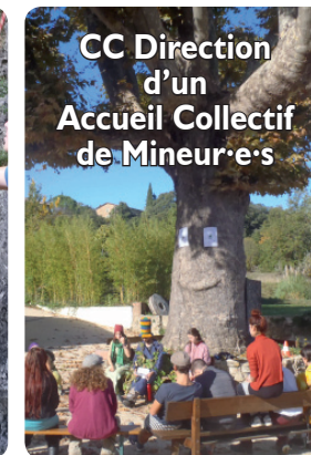
CC Direction d'un Accueil Collectif de Mineur·e·s