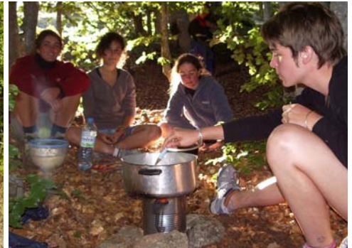
Le bivouac, c'est vraiment bien !!! Ces quelques photos devraient vous convaincre...