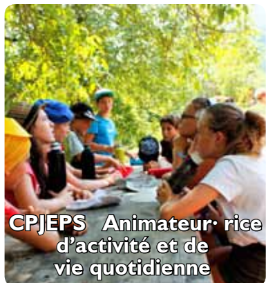
CPJEPS Animateur·rice d'activité et de vie quotidienne