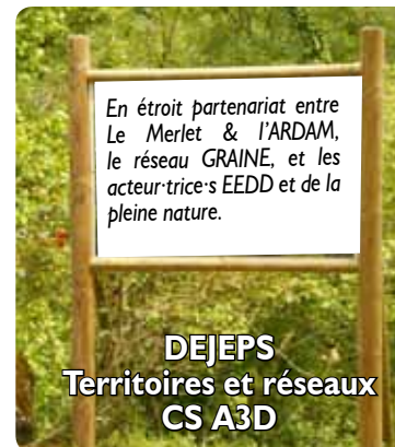
En étroite partenariat entre Le Merlet & l'ARDAM, le réseau GRAINE, et les acteur·trice·s EEDD et de la pleine nature.