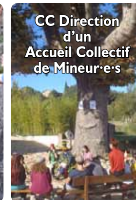
CC Direction d'un Accueil Collectif de Mineur·e·s