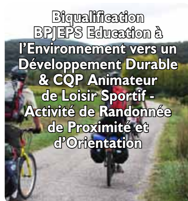
B iquification BPJEPS Education à l'Environnement vers un Développement Durable & CQP Animateur de Loisir Sportif - A ctivité de Randonnée de Proximité et d'Orientation