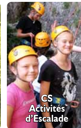
CS Activités d'Escalade